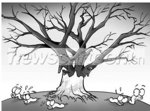
图 5 江苏立法禁“啃老”(梁秋,2011)

图 5 这幅积极主题漫画采用了 PPMs 表征方式,体现具体→具体映射关系,展现“政策受益者”的积极形象。“树木”和“蛀虫”分别指代“老人”和“子女”。“蛀虫”被赶走,胡子