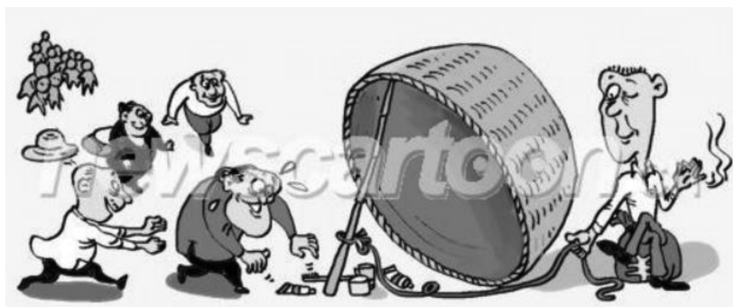
图9 贪小便宜吃大亏(杨霞,2015)

图9这幅消极主题漫画中,无良商家将礼品作为“诱饵”,利用老年人贪图小便宜的心理进行诈骗,展现老年群体“容易受骗的受害者”这一消极形象。这幅漫画属于POMs表征方式,体现具体→(抽象)映射关系。这种表达方式未对目标领域进行明确标识,读者需要结合上下文进行推断和理解。尽管缺乏文字说明,但通过小恩小惠吸引老年人的手段,“陷阱”捕获“猎物”的隐喻已经不言自明。老年人的防范意识相对较弱,他们往往缺乏必要的信息意识和辨别信息真伪的能力(刁春婷等,2020)。媒体通过发布与诈骗相关的报道,向老年人发出警告,反映了社会对这一问题的关注。