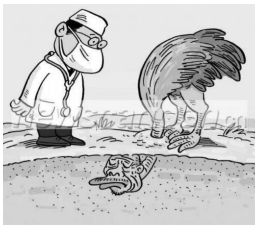
图4 讳疾忌医(范建平,2009)

这幅消极主题漫画通过 PVMs 的表征手法,体现了具体→抽象的映射关系,图中文字引导读者结合语境对图像做出解读。老人身上的“石头”映射“看病缺钱”等经济、家庭和情感压力,喻指老年人所承受的沉重负担。近年来,孤独空虚的生活、对子女的依赖,以及“不再被需要”的心理成为困扰老年人精神生活的重要原因(浦纯钰,2013)。与图2所呈现的宏观社会层面不同,图3揭示了老年人在养老生活中所面临的压力,从另一个角度描绘了“需要帮助的弱势群体”的消极形象。