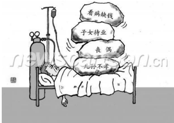
图3 老年人的情感压力(王阳,2006)

这幅消极主题漫画通过 PVMs 的表征手法,体现了具体→抽象的映射关系,图中文字引导读者结合语境对图像做出解读。老人身上的“石头”映射“看病缺钱”等经济、家庭和情感压力,喻指老年人所承受的沉重负担。近年来,孤独空虚的生活、对子女的依赖,以及“不再被需要”的心理成为困扰老年人精神生活的重要原因(浦纯钰,2013)。与图2所呈现的宏观社会层面不同,图3揭示了老年人在养老生活中所面临的压力,从另一个角度描绘了“需要帮助的弱势群体”的消极形象。