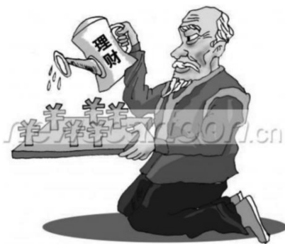
图7 老年人理财意识渐强,比年轻人更关注钱生钱(尹正义,2011)

《保障法》(主席令第七十二号)第十八条规定:“与老年人分开居住的家庭成员,应当经常看望或问候老年人。”(新华社,2012)这一条款体现了法律对中国孝道文化的继承、弘扬和发展(姚明等,2018)。在图6中,《保障法》被拟人化,呈现为拥有老年人特征的“伙伴”,属于PPMs表征方式,体现具体→具体映射关系。这幅漫画展现积极主题,然而从子女为难的状态以及老人无助的神情可以看出制度实行的艰难。老人暗淡的衣着色调与他们无奈、悲伤的情绪形成了呼应。这幅漫画中的老年人形象仍旧停留在上一阶段,被视为“需要帮助的弱势群体”,这表明了此阶段推出的各项措施仍需持续改进。