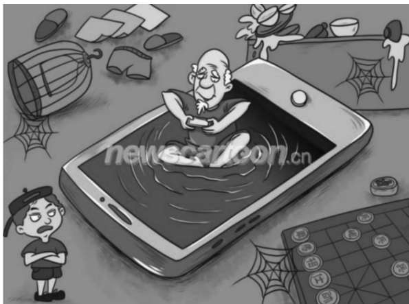
图 11 网瘾老年(张璐璐,2021)

互联网是一把双刃剑,初次接触网络且拥有较多空闲时间的老年人群体很容易沉迷于网络和电子设备。图 11 这幅消极主题漫画描绘出此现象下“网瘾老年”这一消极形象,运用 P\textcircled{O}M_s 表征方式,体现具体→(抽象)映射关系。通过手机屏幕上象征性的沼泽波纹,读者可以推断出漫画中的老人即将被网络的“泥沼”吞噬,暗色调的生活环境也侧面显示出老人沉迷网络,影响到了正常生活。伴随着数字时代智能设备的广泛使用,越来越多的老年人“触网”后深陷其中(王冰,2021),在普及智能技术的同时,老年人网络防沉迷等问题也引起了社会的关注。